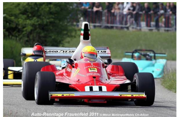
Auto-Renntage Frauenfeld 2011