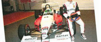
Zürcher muss auf den ersten Einsatz warten.

OPC-PRIMIERE Die zum 12. Mal vom ACS Thurgau durchgeführten Auto-Renntage auf der Allmend in Frauenfeld bieten den Rahmen für den zweiten Lauf zur Schweizer Slalom-Meisterschaft. Rund 140 Fahrerinnen und Fahrer werden auf dem 2.9 km langen Parcours mit 57 Toren zum zweiten Mal nach Interlaken um Punkte kämpfen.