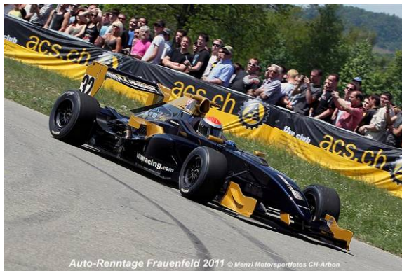
Auto-Renntage Frauenfeld 2011