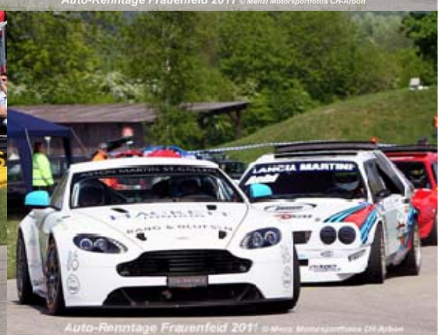
Auto-Renntage Frauenfeld 2011