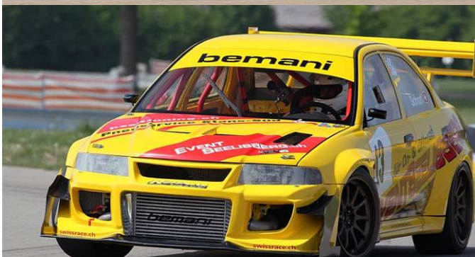
Auto-Renntage Frauenfeld 2011