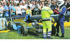
Kam von der Strecke. Cloch nach dem Unfall gibt es schon den ersten Fahrgast.

Rennen in den Gassen 330 Läuferinnen und Läufer gingen am Samstag an den Start zum 3. Bischofzeller Stadtläuf. regio-bericht 13