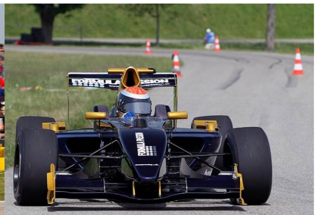
Auto-Renntage Frauenfeld 2011