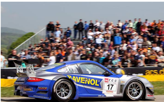
Auto-Renntage Frauenfeld 2011