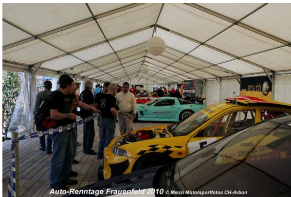
Auto-Renntage Frauenfeld 2010