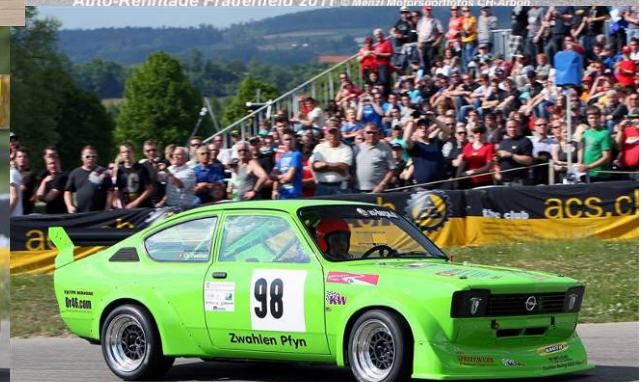
Auto-Renntage Frauenfeld 2011