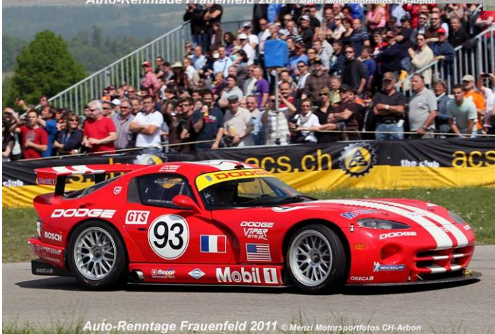
Auto-Renntage Frauenfeld 2011