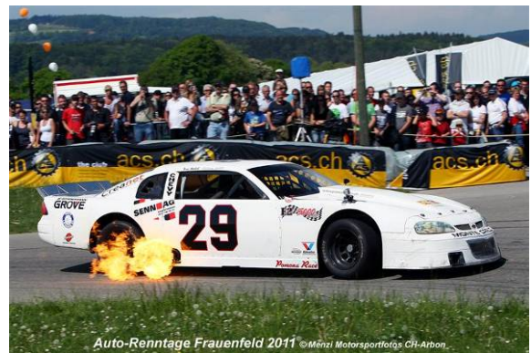
Auto-Renntage Frauenfeld 2011