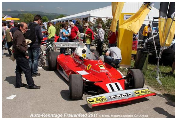
Auto-Renntage Frauenfeld 2011