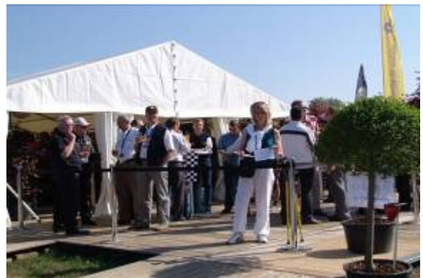
VIP-Apéro für Gäste und Sponsoren