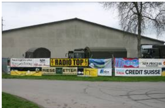
Optimal platzierte Banderolen

Werbeflyer, Versand an 25'000 Haushaltungen im Kanton Thurgau