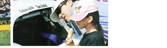
Papa schaut genau – Wüstli, M&M'schen interessieren sich mehr für Glas.